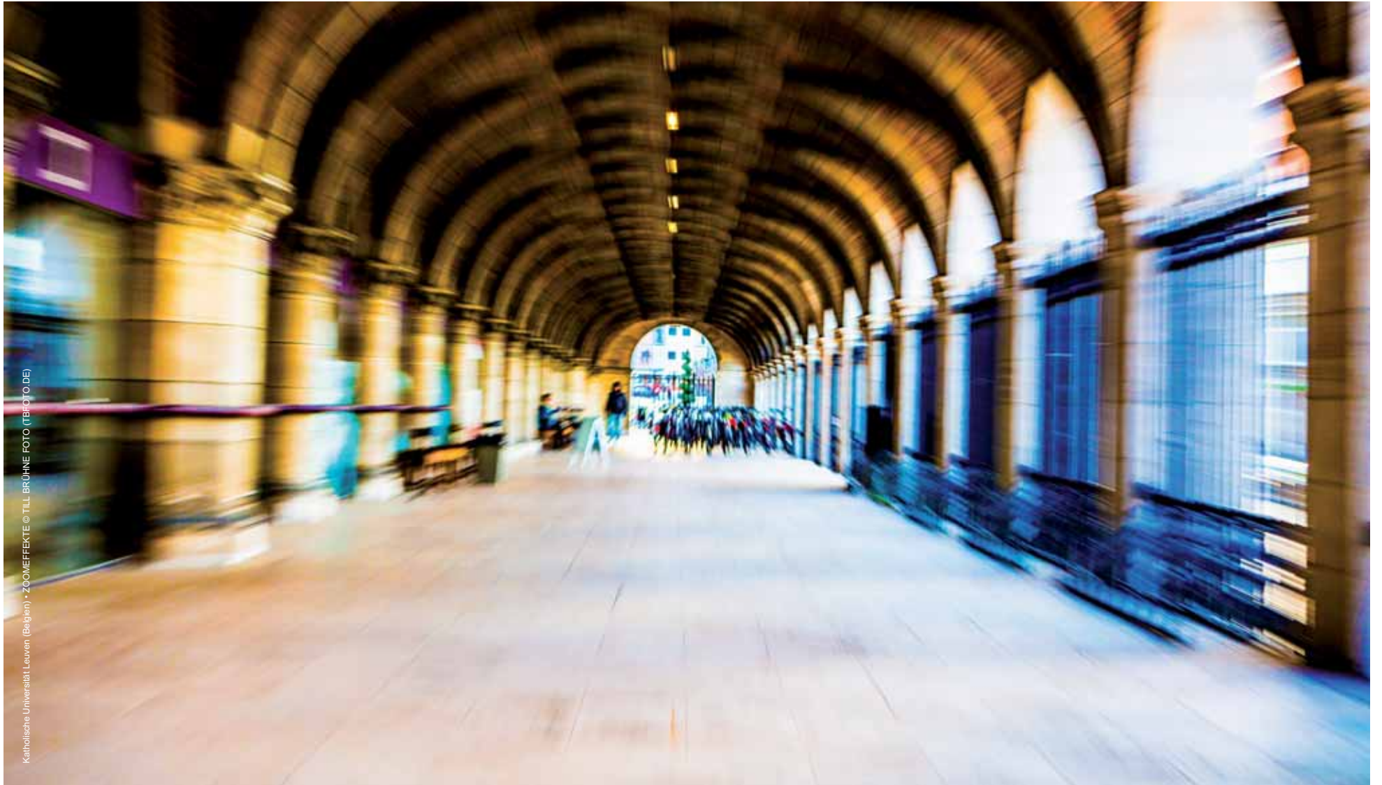
Katholieke Universiteit Leuven (Belgien) - ZOOMEFFEKTE