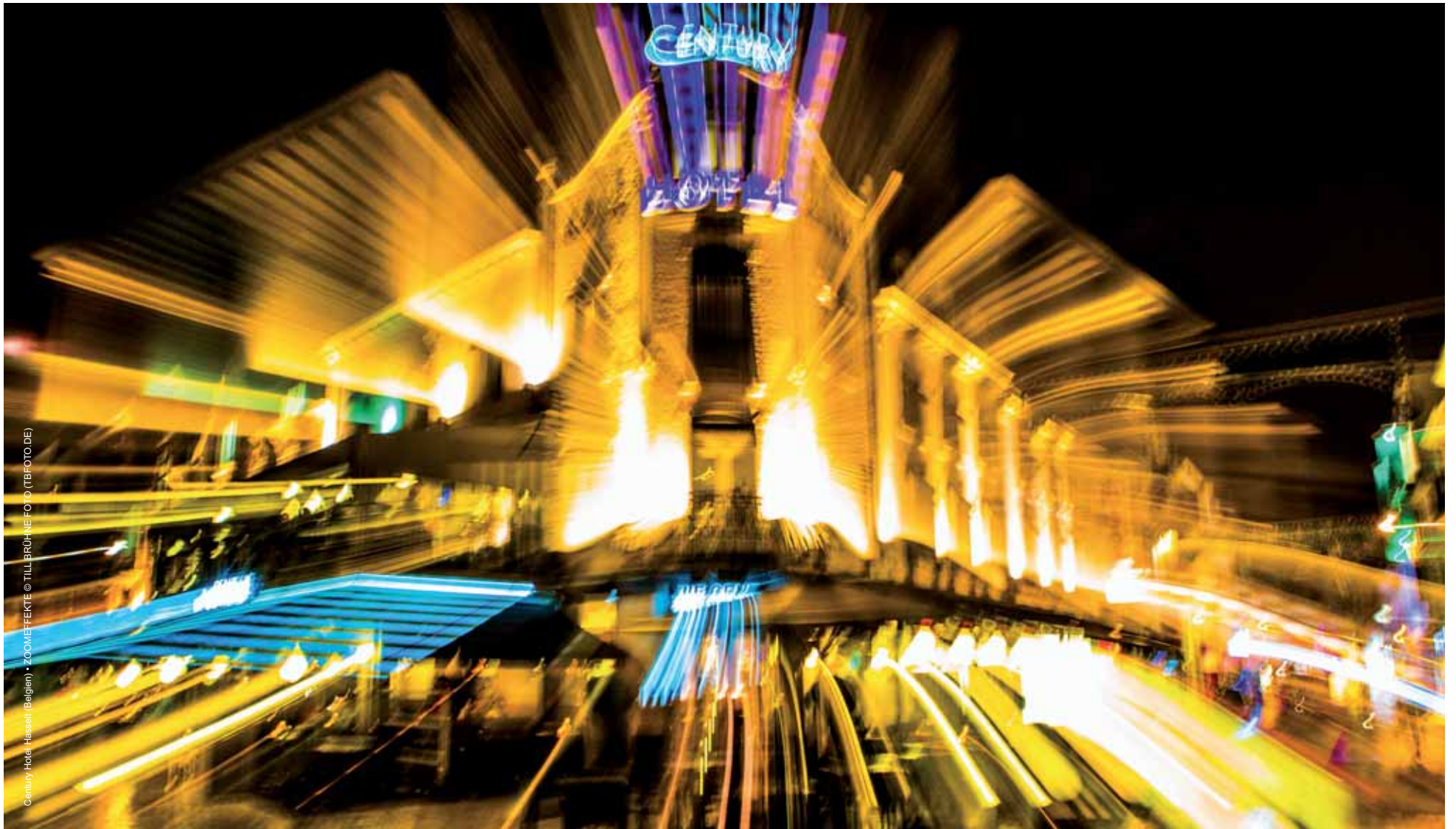
Century, Hotel Hasselt (Belgien) • ZOOMEFFEKTE