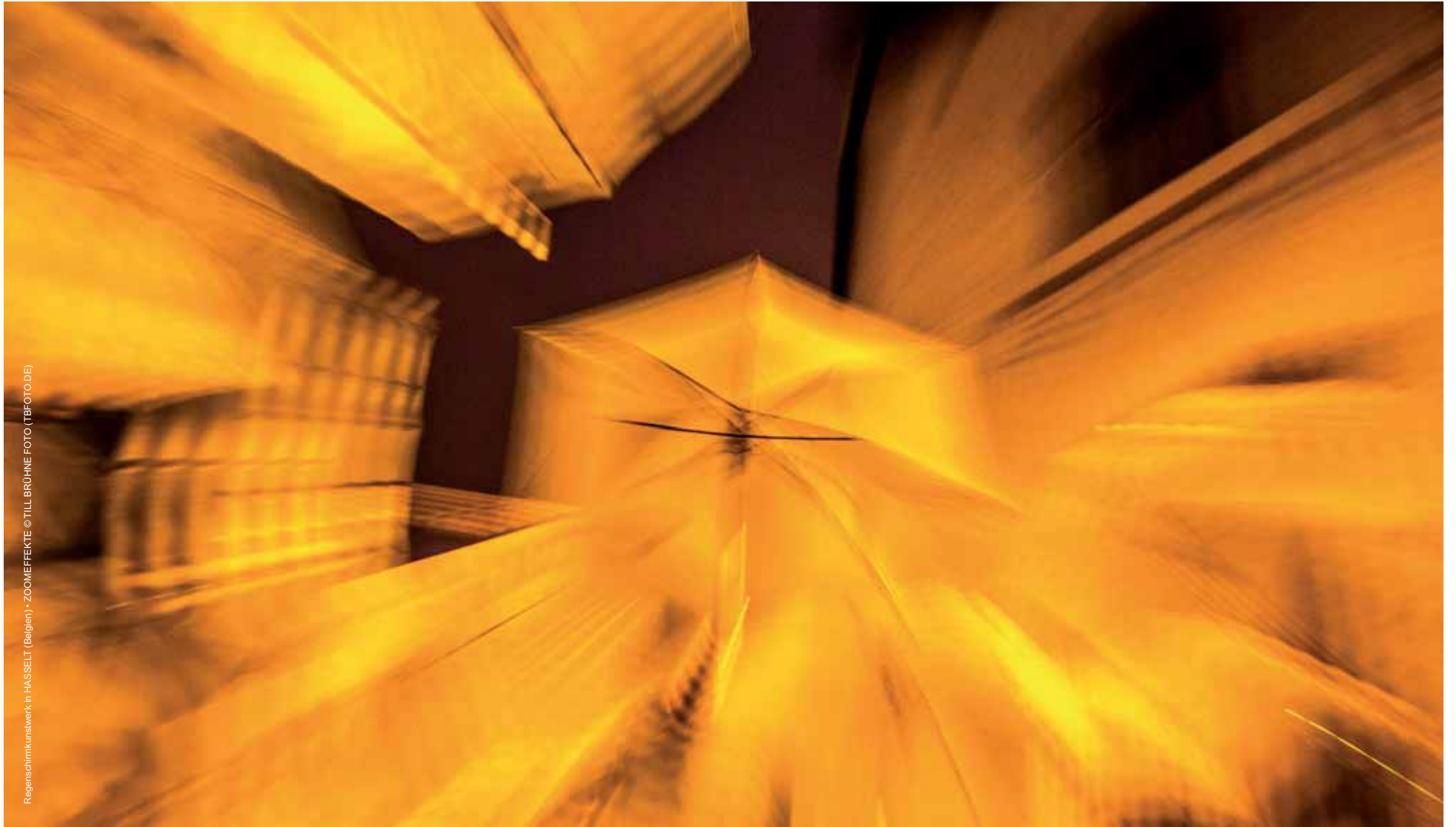
Regenschirmkunstwerk in HASSELT (Belgien) - ZOOMEFFEKTE