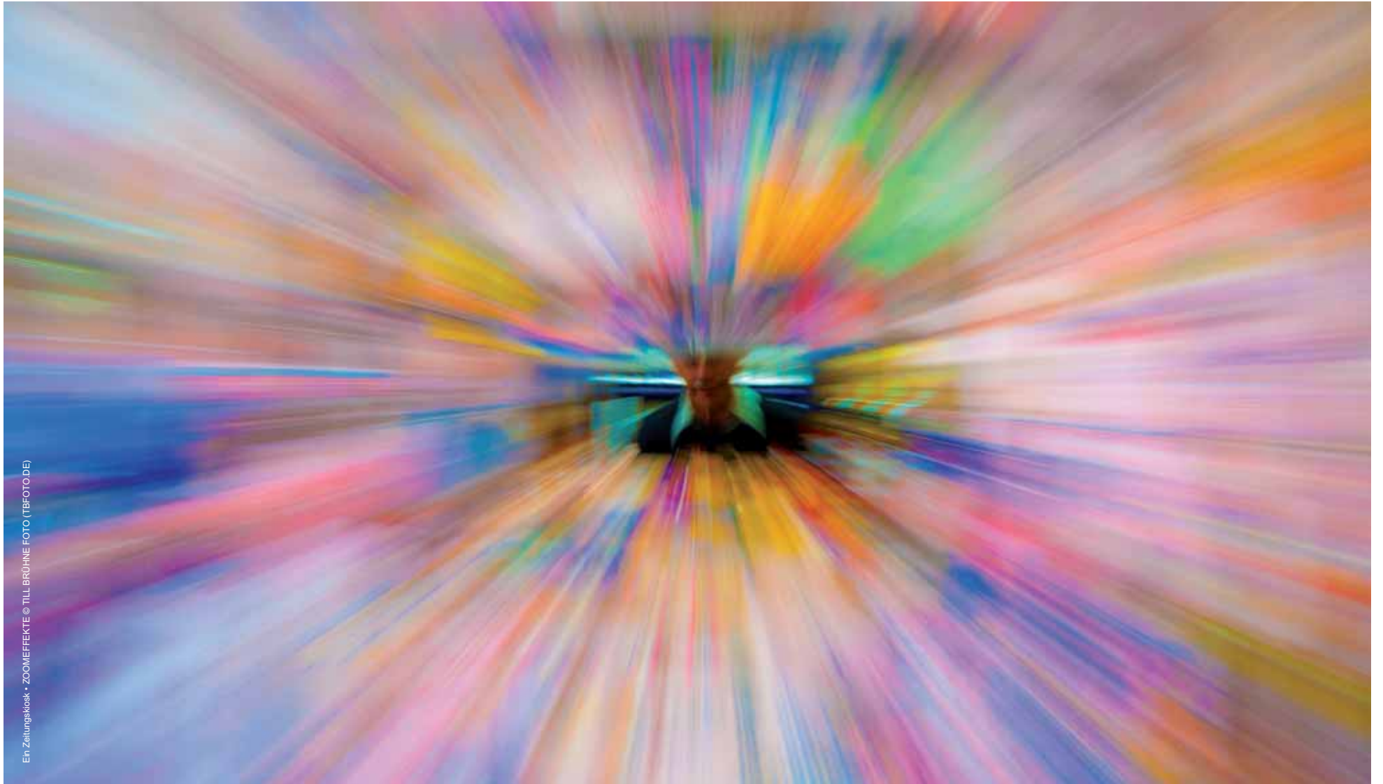
Ein Zeitungskiosk • ZOOMEFFEKTE