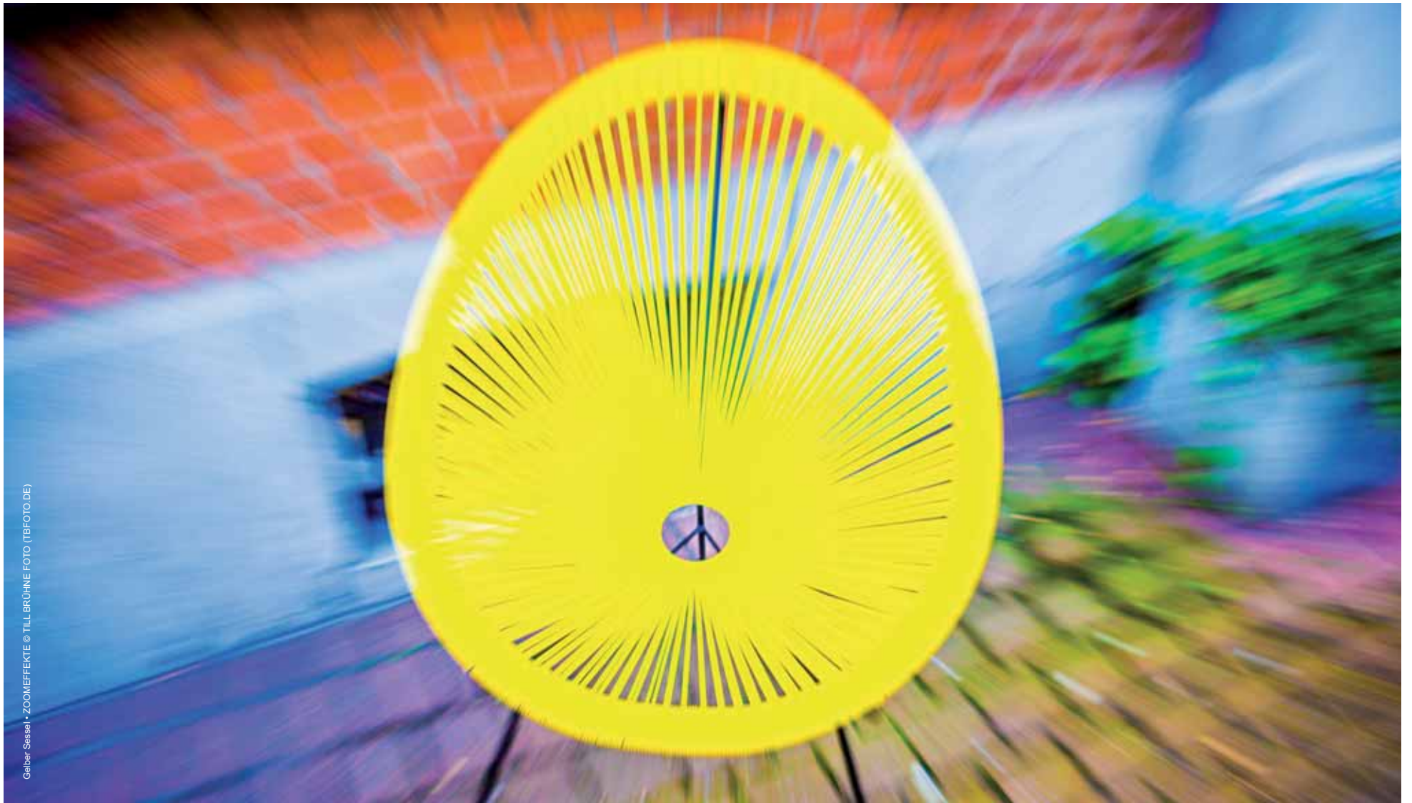
Gelber Sessel • ZOOMEFFEKTE