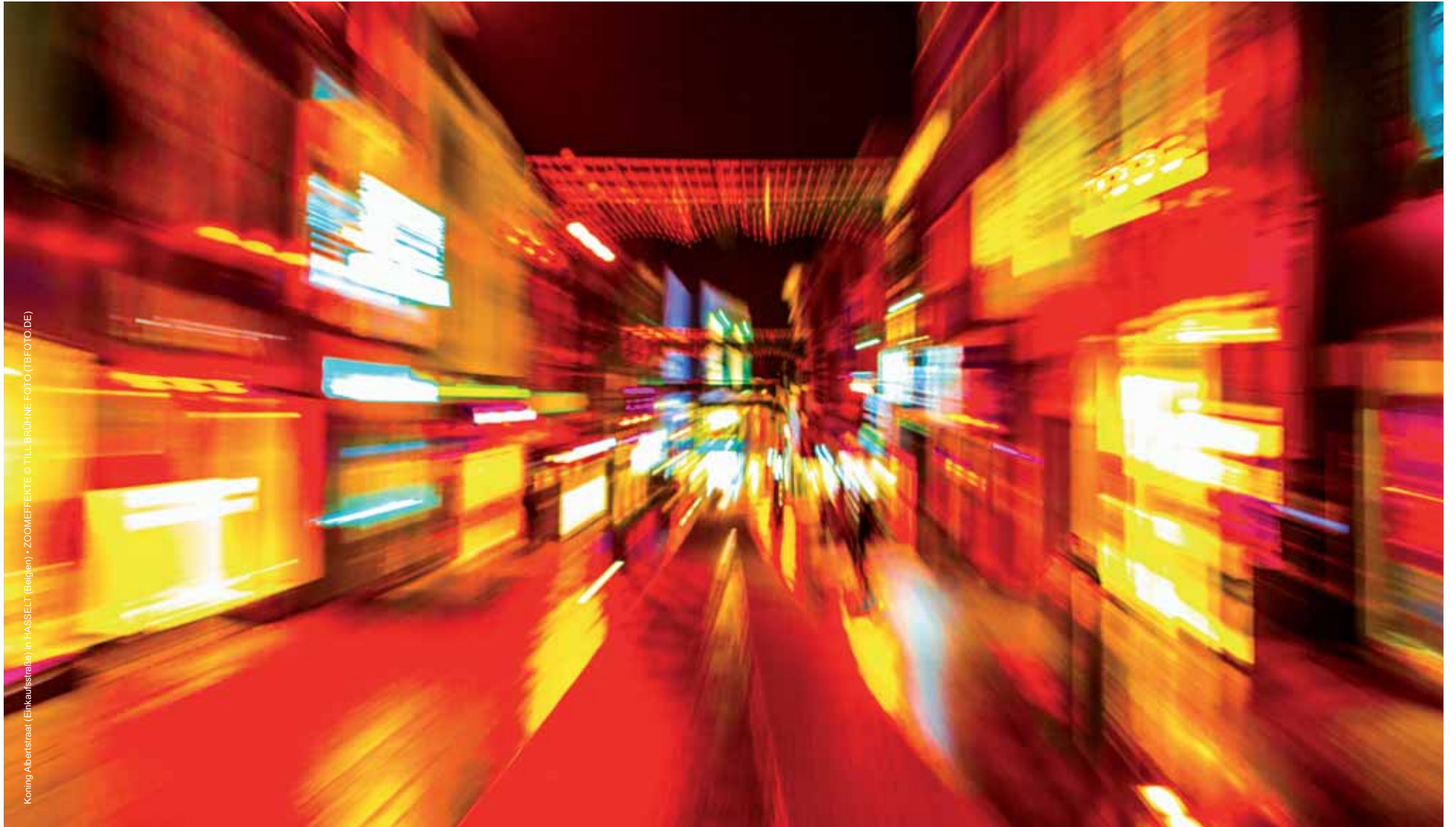
Koning Albertstraat (Einkaufsstraße) in HASSELT (Belgien) • ZOOMEFFEKTE