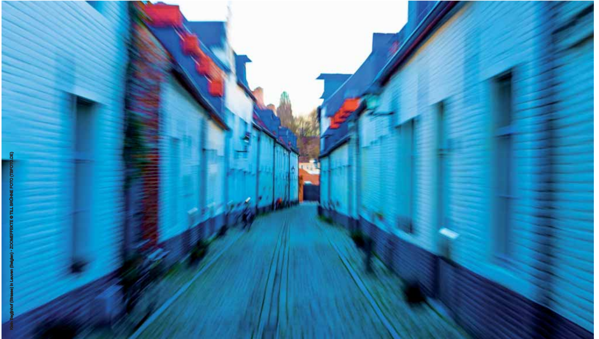
Klein Begijnhof (Strasse) in Leuven (Belgien) • ZOOMEFFEKTE © TILL BRÖHNE FOTO (TBFOTO.DE)