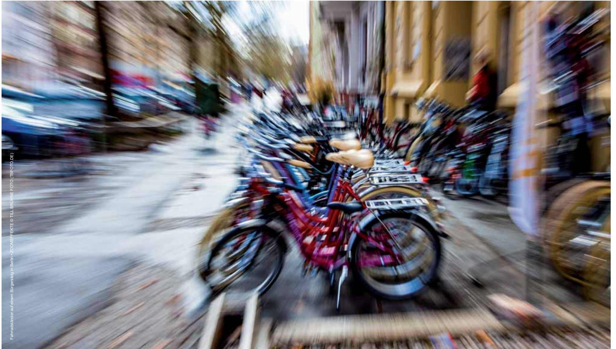
Fahrradständer auf einem Bürgersteig in Berlin • ZOOMEFFEKTE © TILL BRUHNE FOTO (TBFOTO.DE)