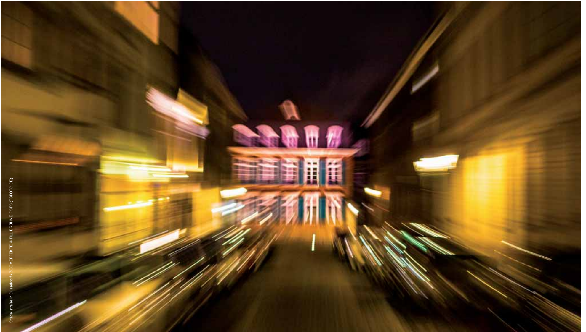
Glacelstraße in Düsseldorf • ZOOMEFFEKTE