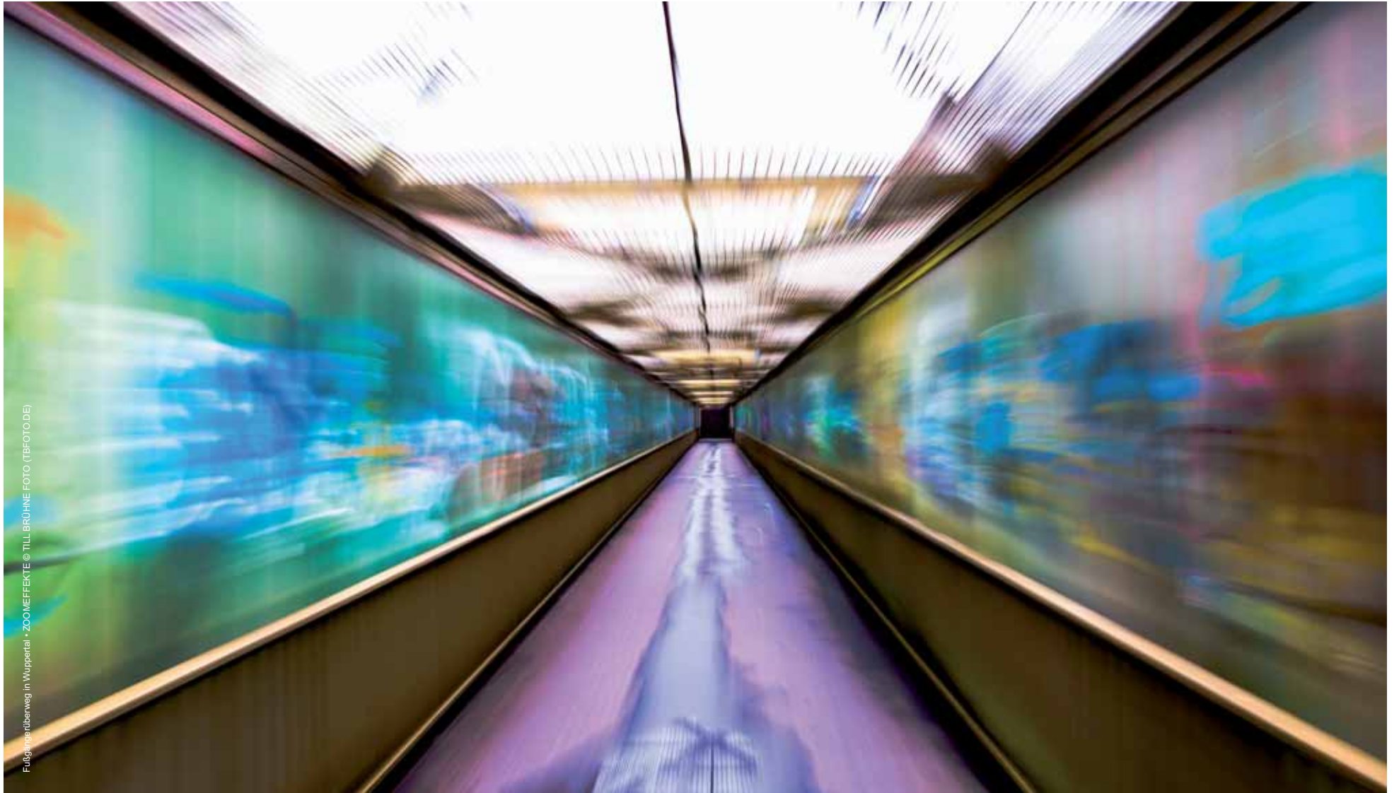
Fuldaerbergweg in Wuppertal • ZOOMEFFEKTE