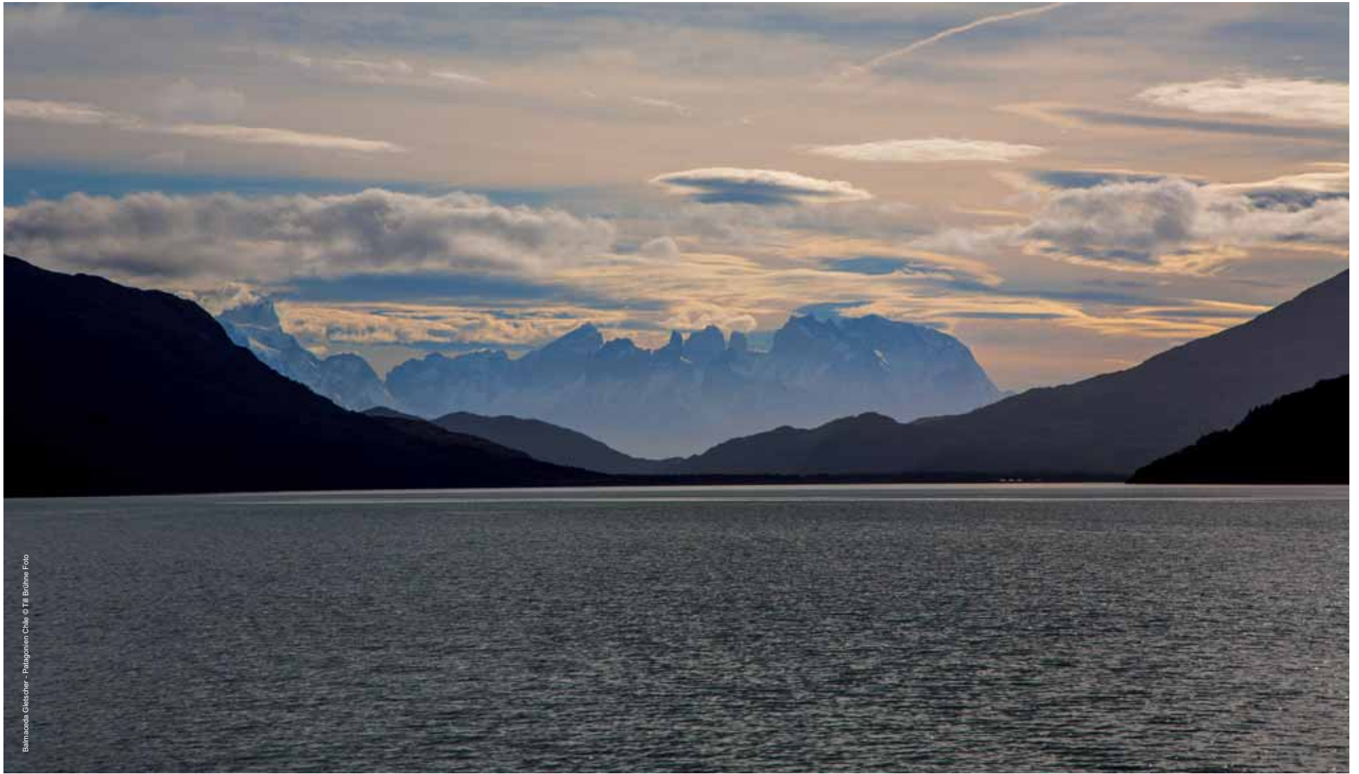
Balmaceda Gletscher - Patagonien Chile