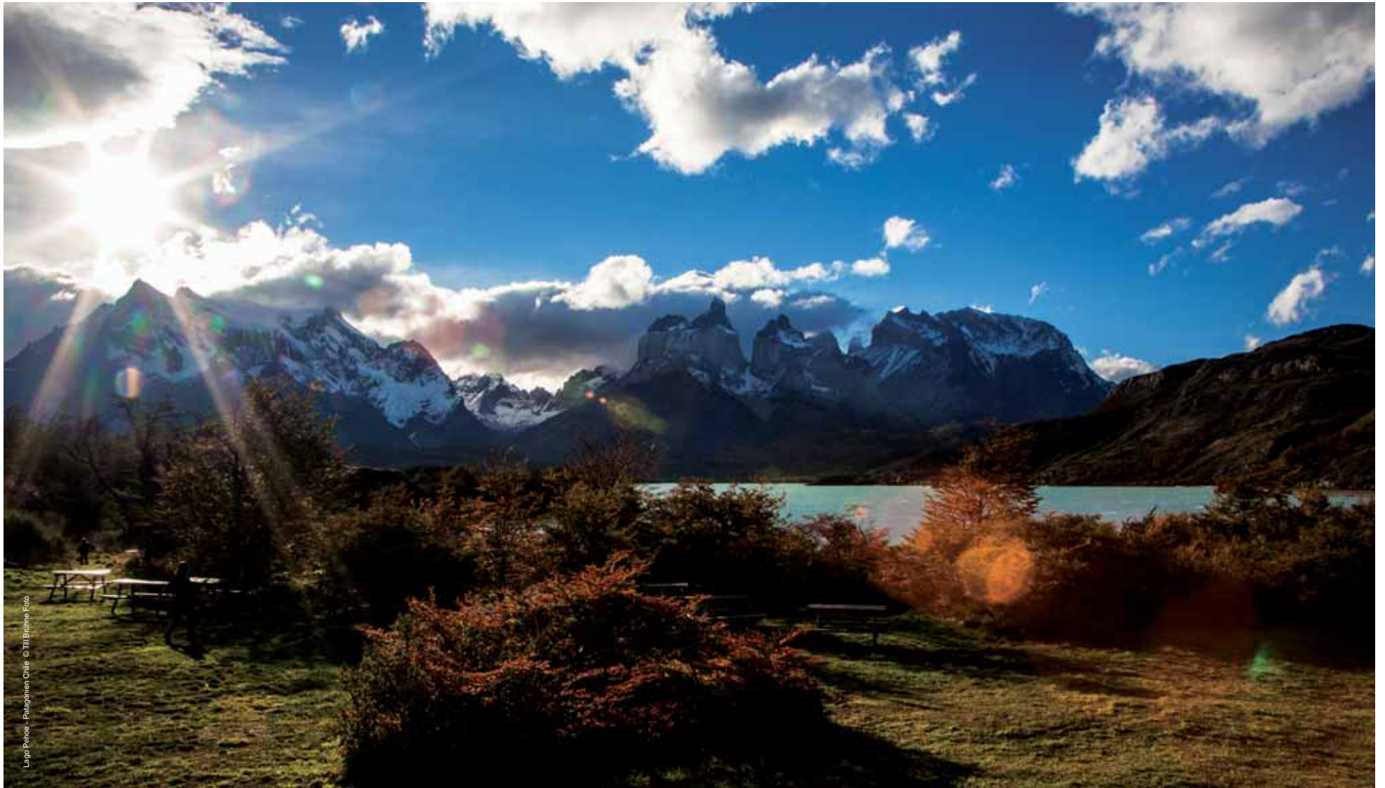
Lago Pehoe - Patagonien Chile