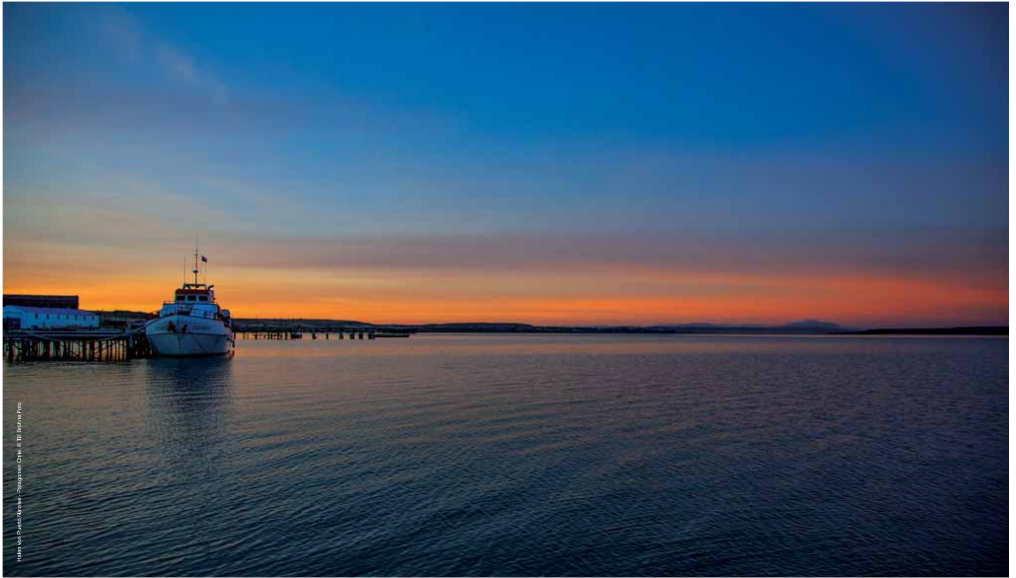
Hafen von Puerto Natales - Patagonien Chile