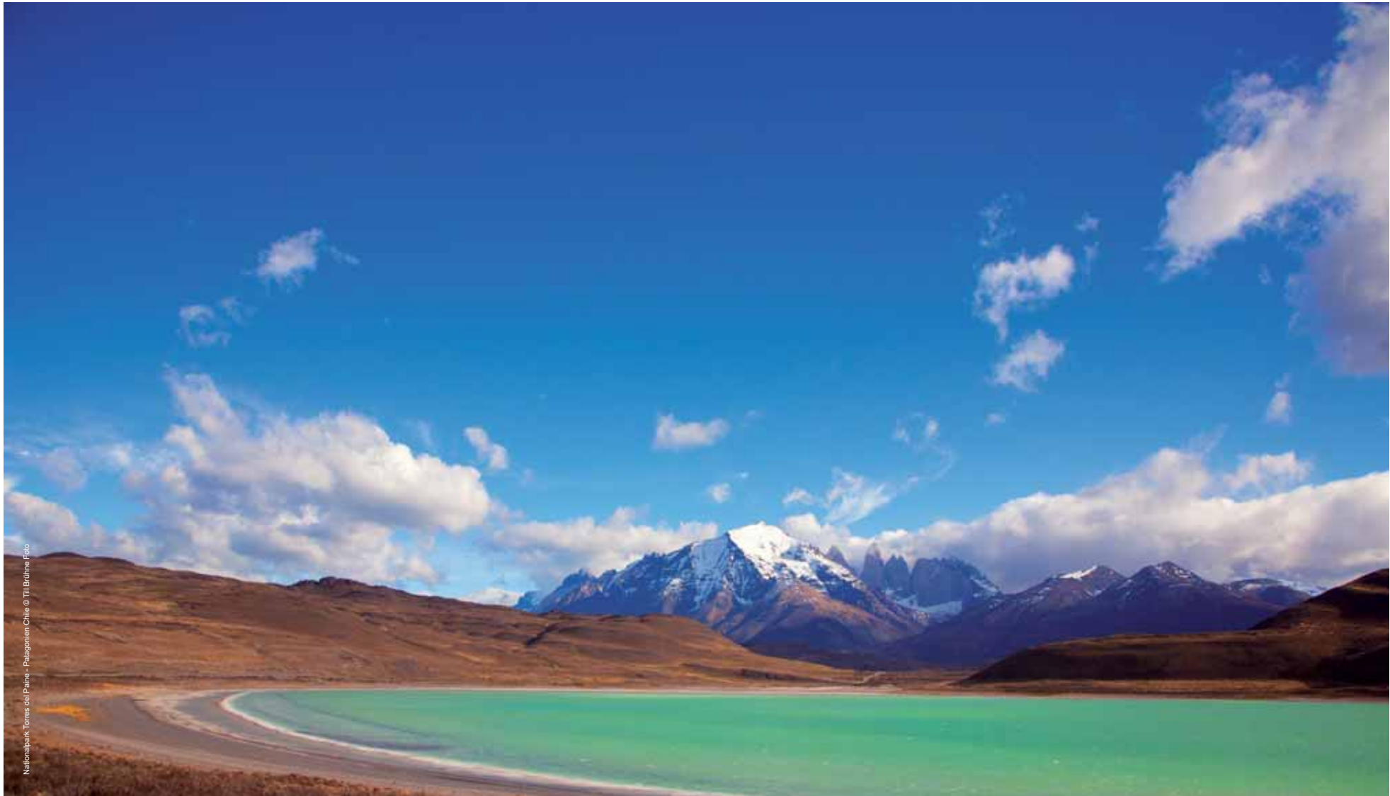
Nationalpark Torres del Paine - Patagonien Chile