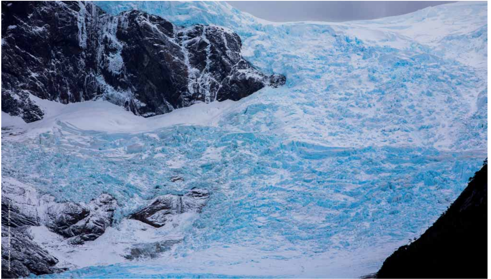
Serrano Glaciar - Patagonien Chile