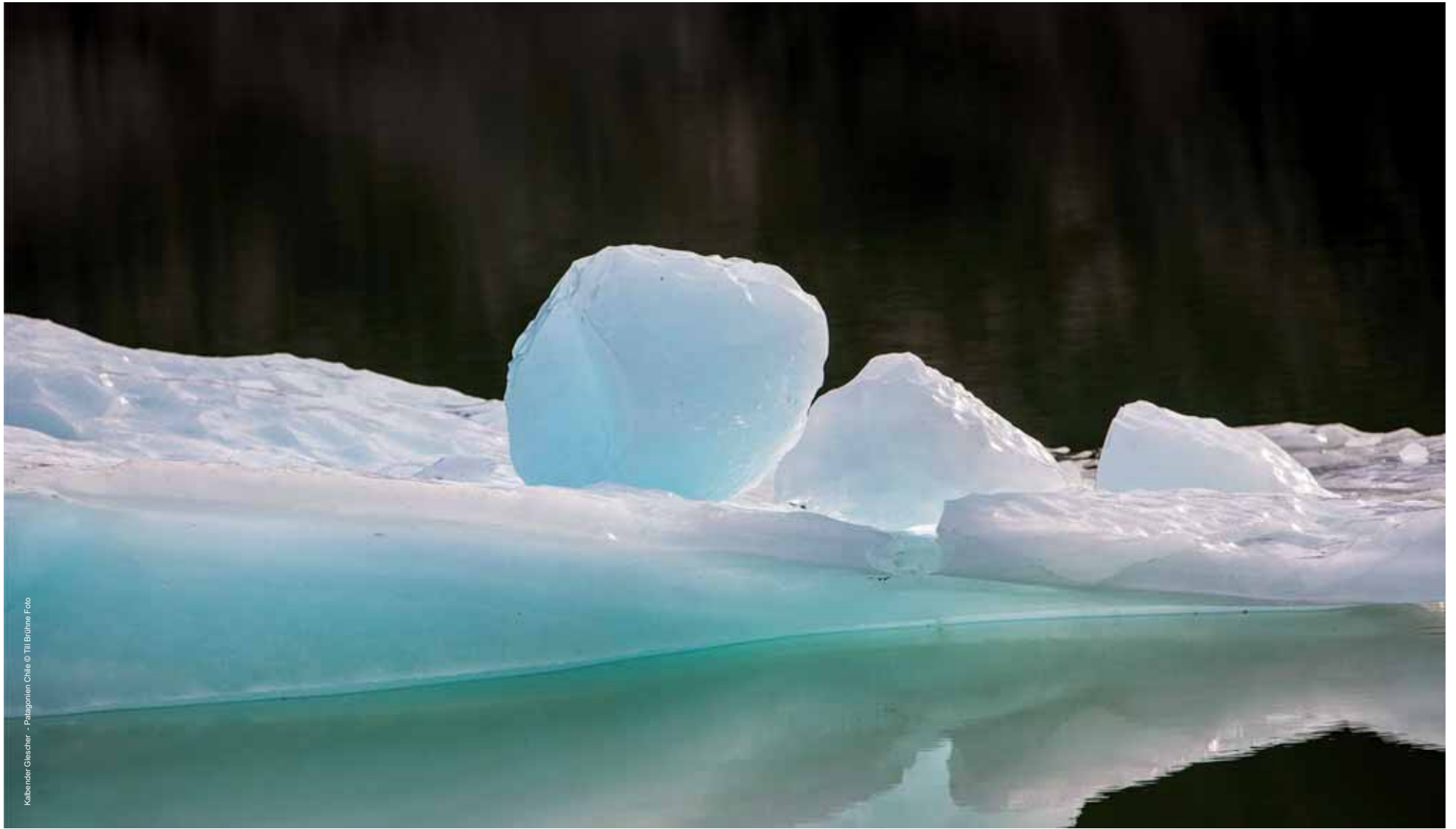
Kalender-Gletscher - Patagonien Chile