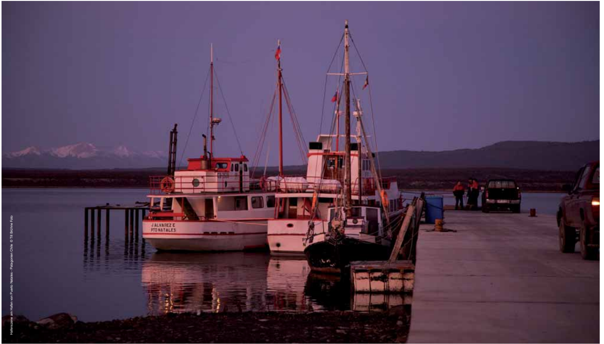
Hafenszene am Hafen von Puerto Natales - Patagonien Chile