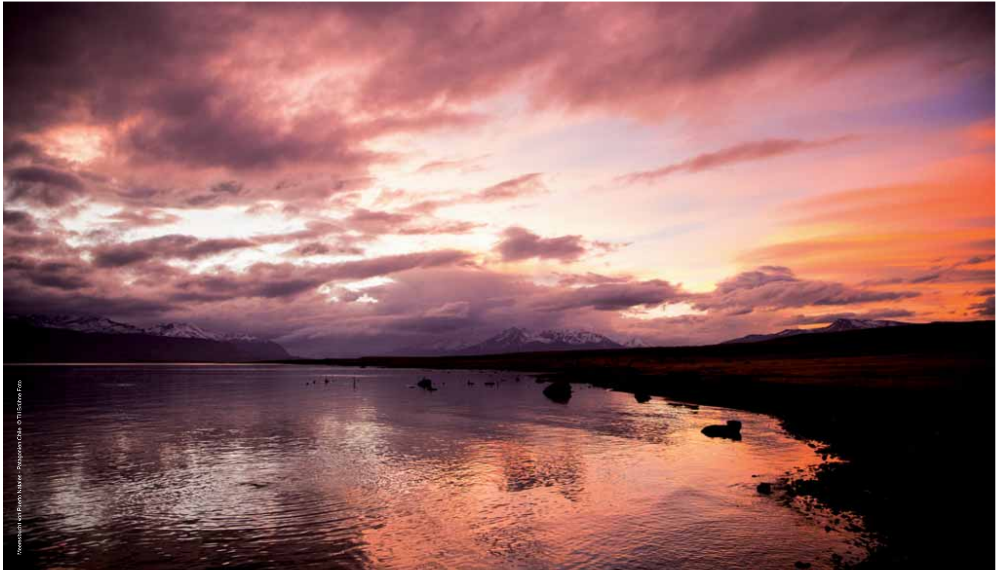
Meeresbucht von Puerto Natales - Patagonien Chile