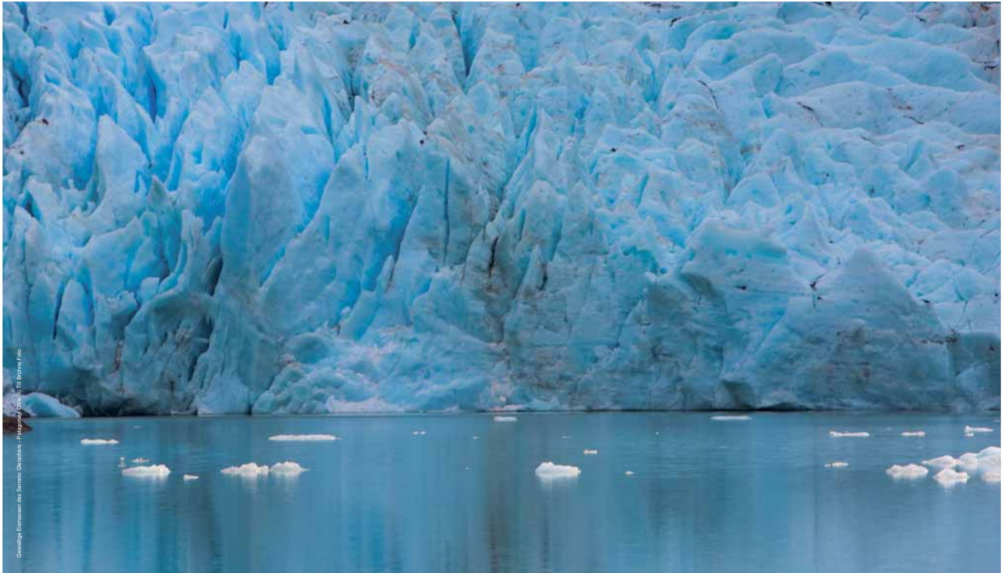
Gewaltige Eismassen des Serrano Gletschers - Patagonien, Chile