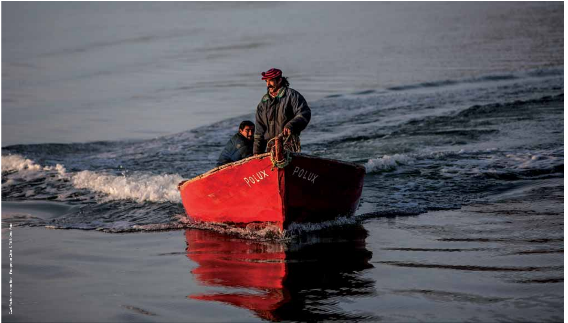
Zwei Fischer im roten Boot - Patagonien Chile